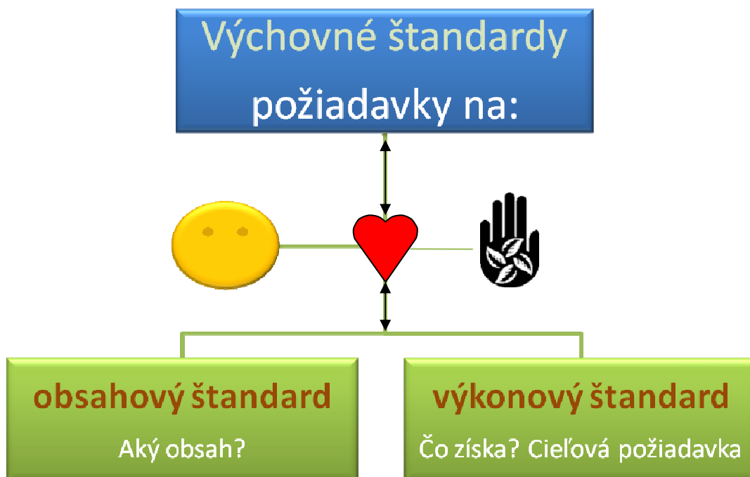
Obrázok č. 3

Súčasťou žiadosti je aj popis záverečnej skúšky. Prosíme, popíšte, ako overíte u účastníkov, že ste dosiahli svoje stanovené ciele. Skúška môže mať písomnú alebo ústnu podobu alebo formu praktickej úlohy. Pri stanovení formy a obsahu skúšky vám pomôže nasledujúca schéma: