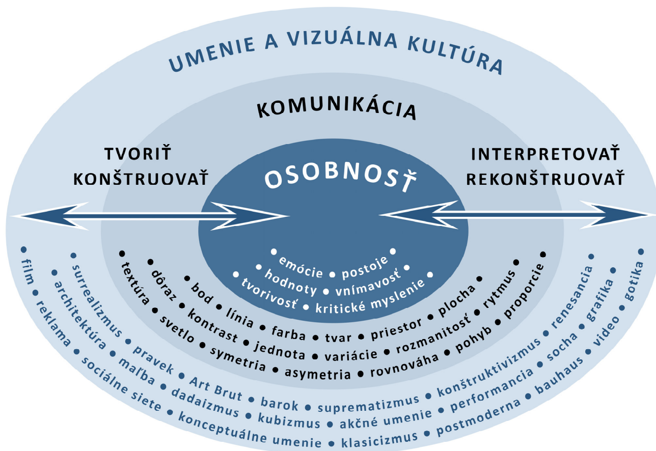
Obrázok č. 2. Komponenty vyučovacieho predmetu výtvarná výchova