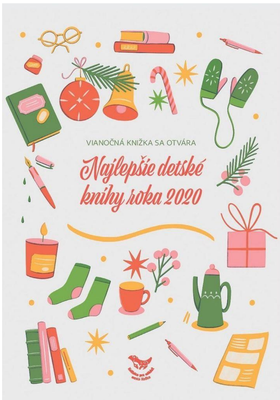
obálka katalógu Vianočná knižka sa otvára za rok 2020

2. Oplatí sa poradiť s katalógom Vianočná knižka sa otvára , ktorý každý rok pripravuje Knižnica pre mládež mesta s tímom nadšencov kvalitnej detskej literatúry.