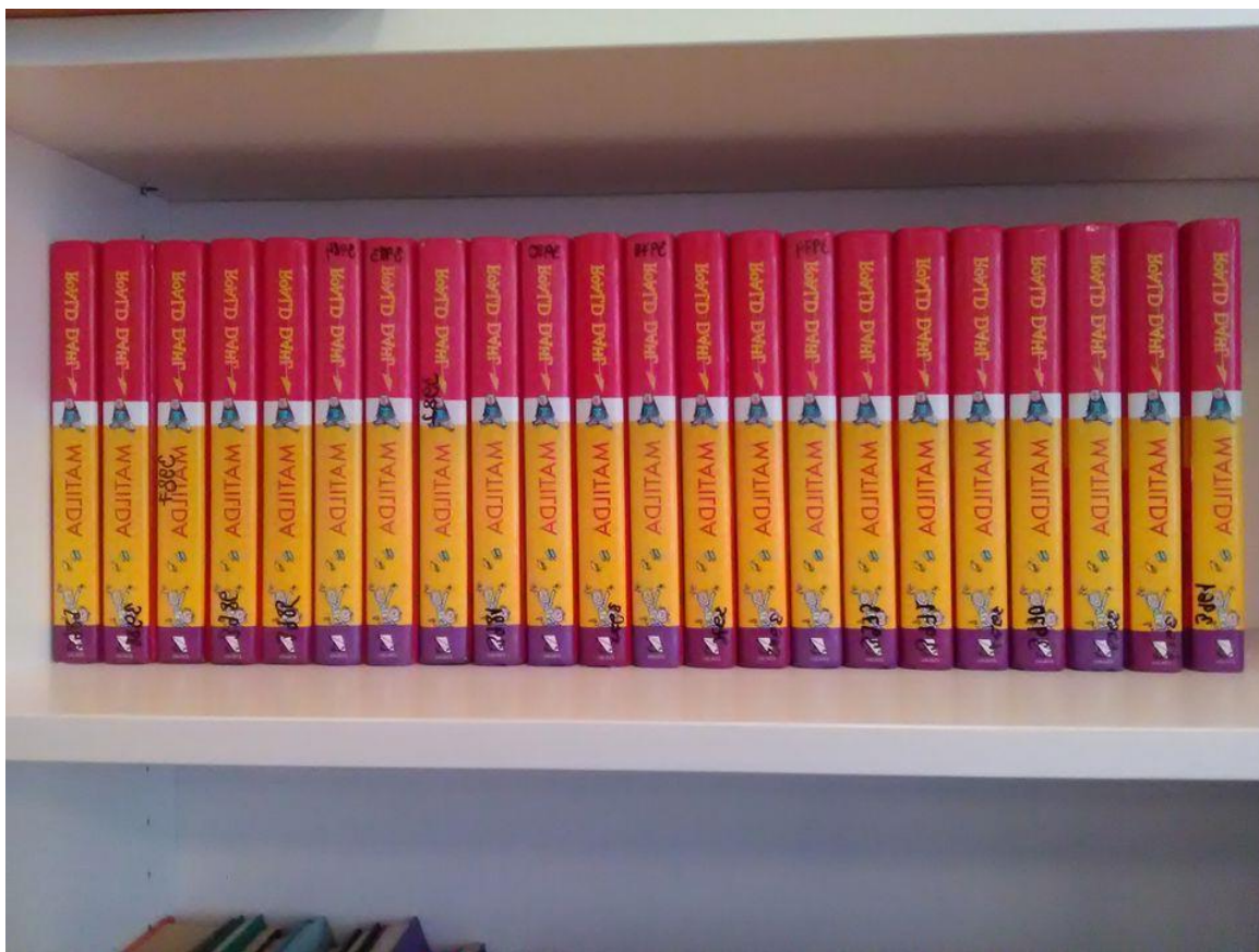
Polica, z ktorej sa dá prečítať iba jedna kniha