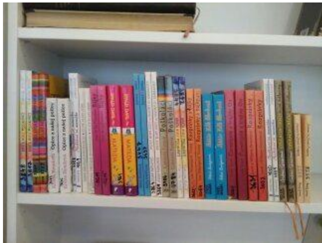
polica z ktorej sa dá prečítať 18 kníh

Ak nakúpíte po 2 kusy z jedného titulu, Vaša knižnica bude vyzerat' takto: