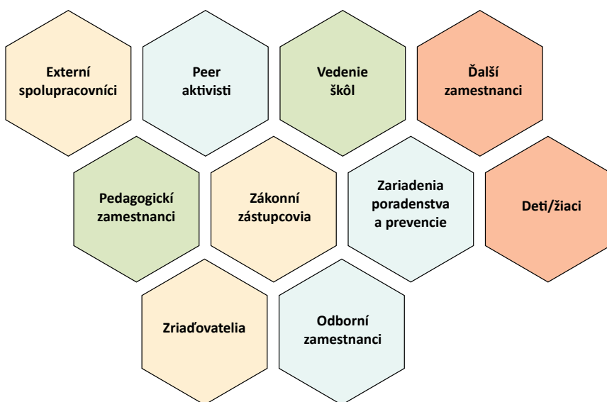
Obrázok č. 4: Aktéri školskej komunity

Je žiaduce, ak sú o činnosti ŠPT informovaní všetci dôležití aktéri školskej komunity: