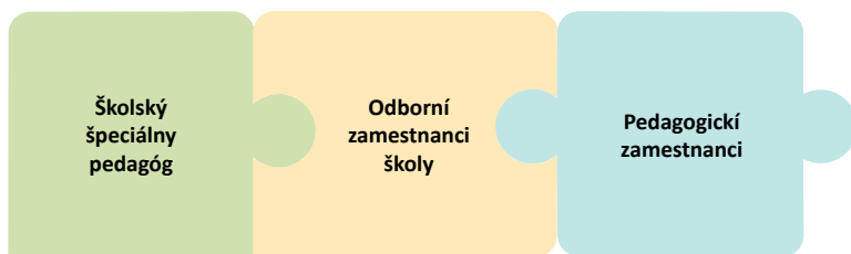
Obrázok č. 2: Zloženie školského podporného tímu

Podľa § 84a ods. 2 zákona č. 138/2019 Z. z. „členom školského podporného tímu je školský špeciálny pedagóg a všetci odborní zamestnanci príslušnej školy . Členmi školského podporného tímu môžu byť aj iní pedagogickí zamestnanci .“ Zloženie ŠPT je upravené riaditeľom vo vnútornom predpise školy po prerokovaní v pedagogickej rade, ak je zriadená. Má reflektovať potreby školy.