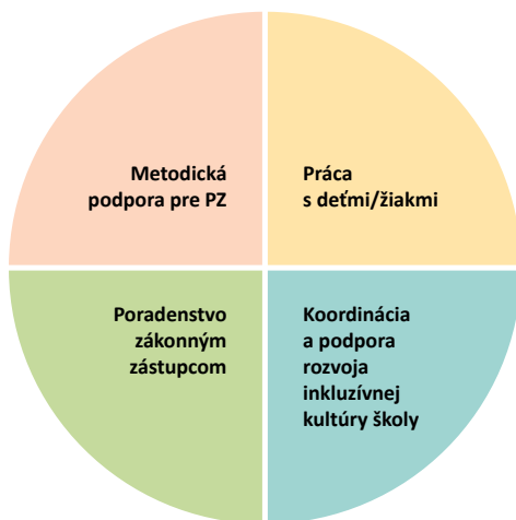
Obrázok č. 3: Oblasti činností členov školského podporného tímu