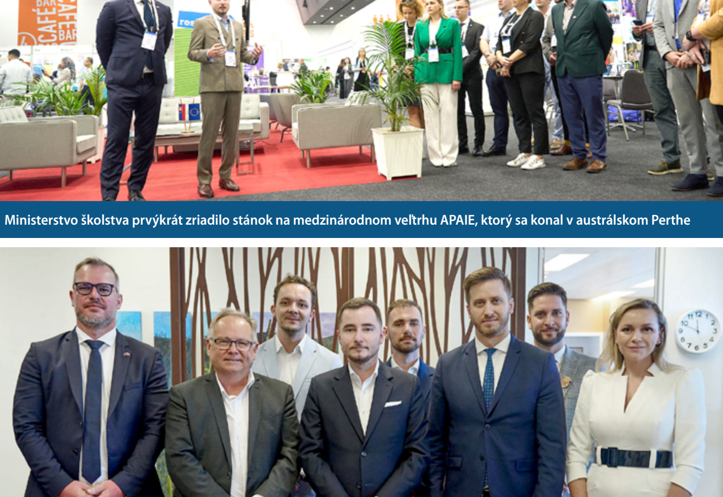
Ministerstvo školstva prvýkrát zriadilo stánok na medzinárodnom veľtrhu APAAE, ktorý sa konal v austrálskom Perthe