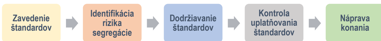
Obrázok č. 1 Uplatňovanie štandardov dodržiavania zákazu segregácie vo výchove a vzdelávaní

Uplatňovanie Štandardov dodržiavania zákazu segregácie vo výchove a vzdelávaní pre školy a školské zariadenia v zmysle školského zákona znamená zavedenie a dodržiavanie pravidiel, princípov a postupov na predchádzanie segregácie , identifikáciu rizika segregácie a nápravu segregáčného konania , pokiaľ bolo indikované na základe kontroly .