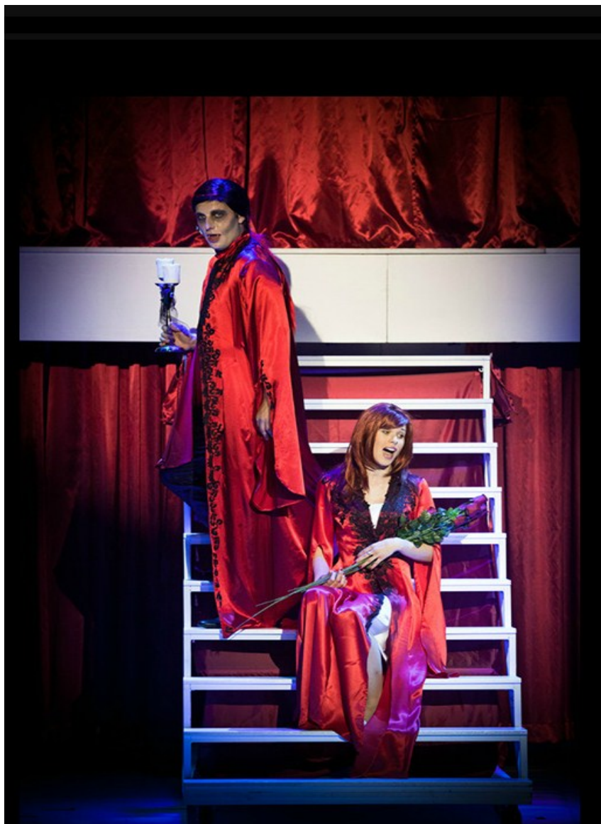
Fotografia č. 1 až 3 Fotodokumentácia z predstavenia Ples upírov, odohrané študentmi a doktorandmi Katedry hudby UKF v Nitre

Moderné vzdelávanie pre vedomostnú spoločnosť/ Projekt je spolufinancovaný zo zdrojov EÚ