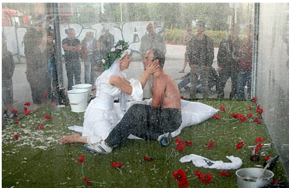
Fotografia č. 6 až 7 – ukážky využitia Univerzitného tvorivého ateliéru na vzdelávanie študentov UKF Nitra – hosťovanie amatérskych divadelných súborov