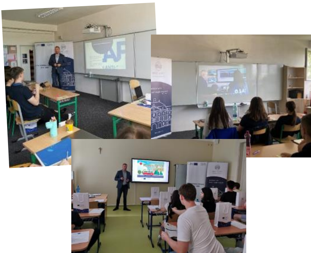
Prednáška na Súkromnom bilingválnom gymnáziu BESST a na Arcibiskupskom gymnáziu biskupa P. Jantauscha v Trnave, 03. jún 2022