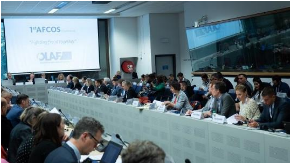
Zdroj: tlačová novinka OLAF zo dňa 06. 10. 2022

nedávne zmeny v oblasti boja proti podvodom na úrovni EÚ, oznamovanie nezrovnalostí a jeho význam pre prevenciu a odhaľovanie podvodov, národné stratégie boja proti podvodom, možnosti finančnej podpory OLAF-u pre vnútroštátne orgány, nástroje na analýzu informácií, výmena informácií a vzájomná podpora počas vyšetrovaní OLAF-u.