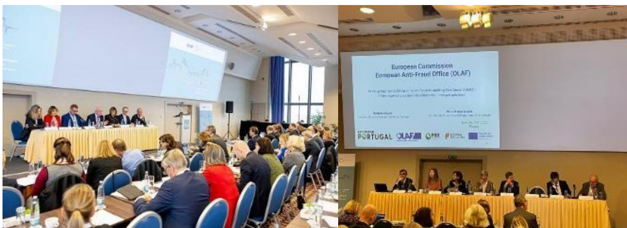
Konferencia EÚ: “Predchádzať - Odhaľovať - Vyšetřovať: Nové výzvy v boji proti podvodom a nezrovnalostiam vo výdavkovej oblasti”, Praha, dňa 23. 11. 2022 - 25. 11. 2022