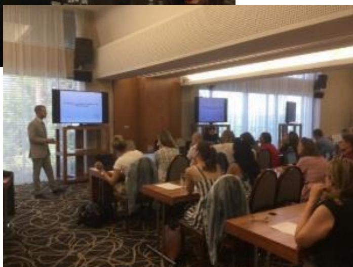
„Zmeny zákona o verejnom obstarávaní v roku 2022 a ich dopady“, 27. 06. 2022, účelové zariadenie ÚV SR Hotel Bôrik, Bratislava