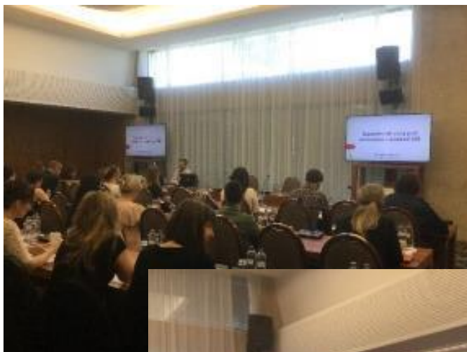
„Riadenie rizík a boj proti podvodom v prostredí EŠIF“, 12. 05. 2022, účelové zariadenie ÚV SR Hotel Bôrik, Bratislava