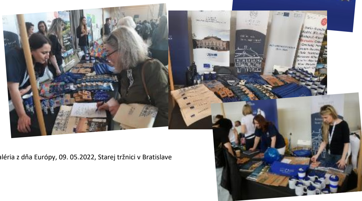
Fotogaléria z dňa Európy, 09. 05.2022, Starej tržnici v Bratislave