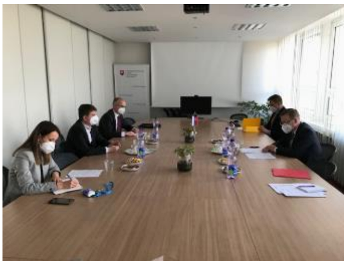
Predstavitelia PMÚ SR a ÚOHS počas pracovnej návštevy, 02. 02. 2022, Bratislava

V rámci ďalšieho rozvíjania bilaterálnej spolupráce s partnerským úradom na ochranu hospodárskej súťaže v Českej republike (ďalej len „ÚOHS“) predstavitelia PMÚ SR dňa 2. 2. 2022 privítali hostí z ÚOHS na pracovnej návšteve v Bratislave. Pre obe strany bola pracovná návšteva príležitosťou na podrobné prekonzultovanie viacerých aktuálnych výziev , ktorým v súčasnosti čelia obe inštitúcie a zároveň na zaujatie jednotného a čo najlepšieho postoja k riešeniu momentálnych otázok pri ochrane hospodárskej súťaže a presadzovaní jej princípov.