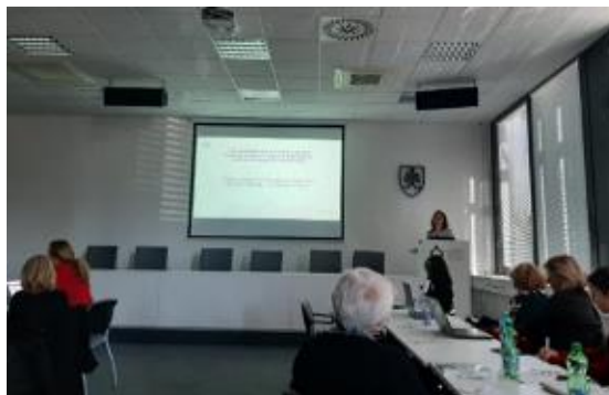
Vedecký park UK, Ilkovičova 8, Bratislava

Dňa 23. septembra 2022 prezentovala zamestnankyňa ONÚ OLAF na Diskusnom fóre: Vzdelávanie v oblasti finančnej gramotnosti v kocke tému OFZ EÚ a boj proti podvodom, ktorá je súčasťou výučby prierezovej témy Finančná gramotnosť na školách už od roku 2014. Organizátorom podujatia bol Štátny inštitút odborného vzdelávania, odbor Finančnej gramotnosti a Slovenského centra cvičných firiem a Úsek celoživotného vzdelávania. Partnerom podujatia bola Sektorová rada pre bankovníctvo, finančné služby, poisťovníctvo. V príspevku boli prezentované úlohy ONÚ OLAF a OLAF-u, ako aj vysvetlené základné pojmy, ktoré súvisia s témou OFZ EÚ a boja proti podvodom. Na praktickom príklade boli vysvetlené fázy protipodvodného cyklu. V príspevku boli uvedené trestné činy, ktoré sa týkajú poškodzovania finančných záujmov EÚ. V závere príspevku bol vysvetlený spôsob nahlasovania podozrení z nezrovnalostí a podvodov pri čerpaní prostriedkov EÚ. Viac informácií sa nachádza v tlačovej správe ONÚ OLAF zo dňa 28. 09. 2022.